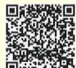
捐贈者自我檢測項目