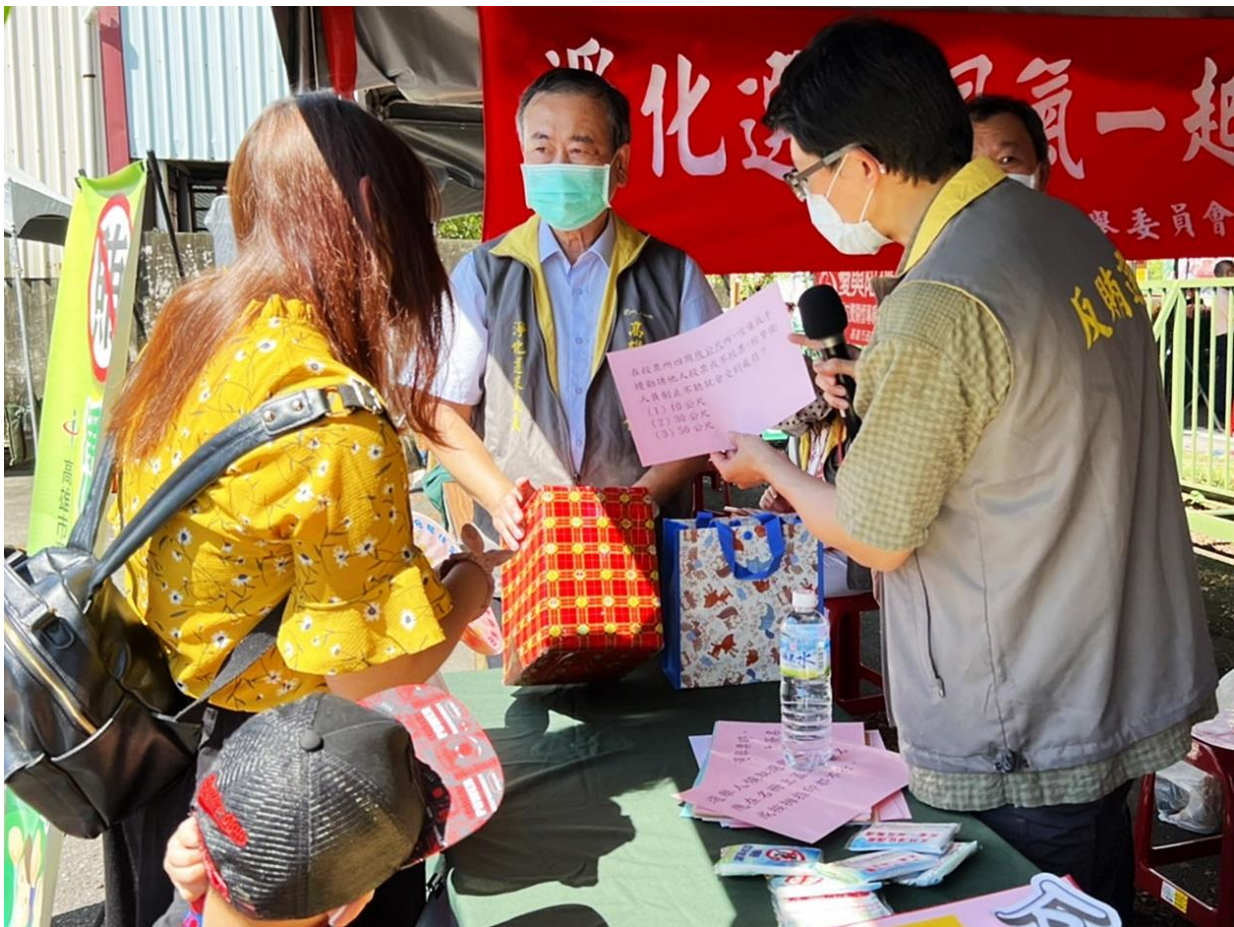
大人小孩一起來，踴躍參與有獎徵答活動!