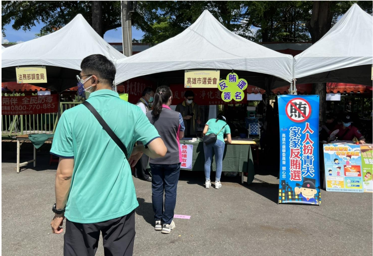
配合防疫，民眾排隊都有保持社交安全距離~