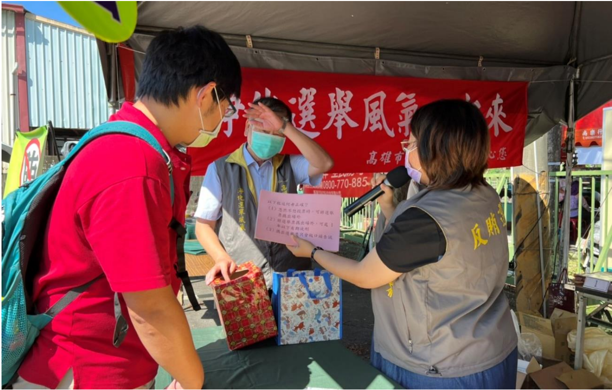
不要緊張，只要有心... 人人都可以拿獎品!