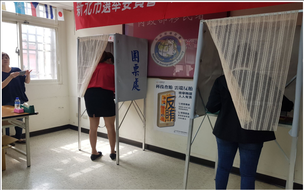
說明：模擬投票情形(2)