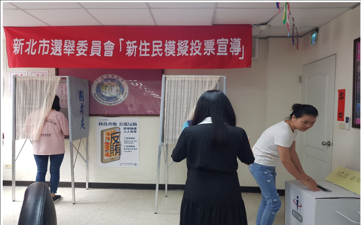
說明：模擬投票情形(3)