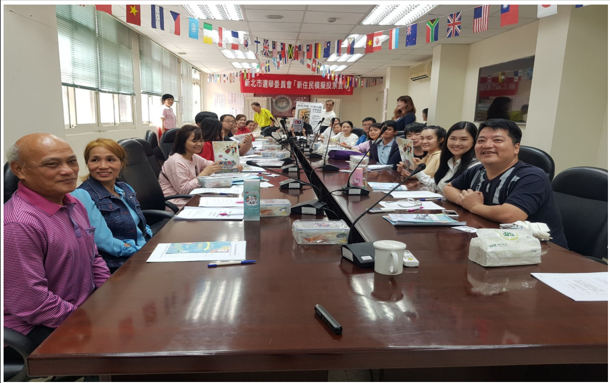
說明：學員上課情形