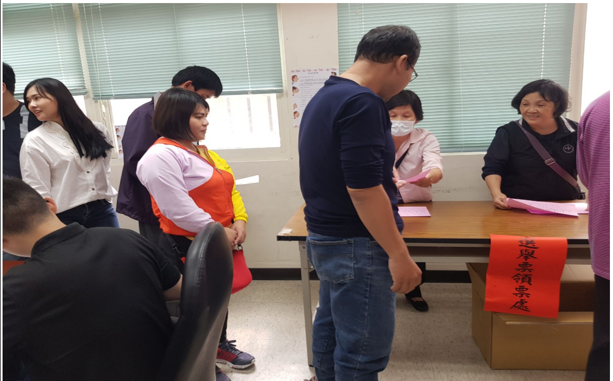
說明：模擬投票情形(1)