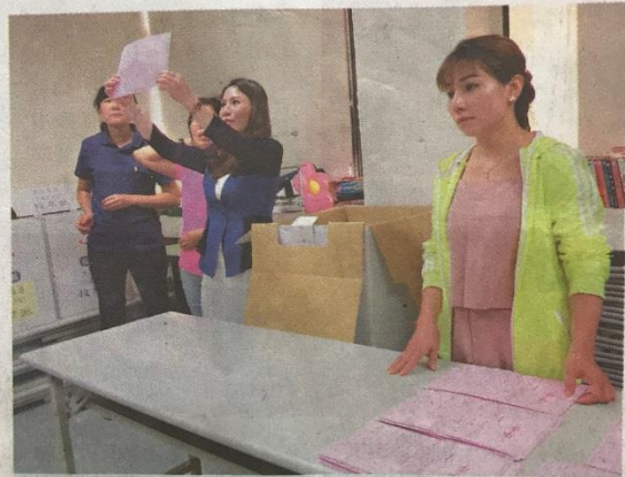
新住民踴躍加入2020選舉選務工作，苗栗縣選委會昨天辦理講習、模擬選舉流程。

她們說，目前兩岸關係緊張，她們處處受限，大陸新住民6年才能有身分證，再10年才能參加選務工作，其他國家新住民3年拿到身分證，並可以參加選務工作，台灣、大陸同文同種卻不同待遇，心中很受傷害。